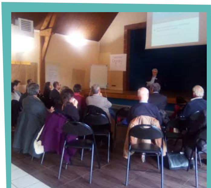
Atelier de concertation sur la gouvernance