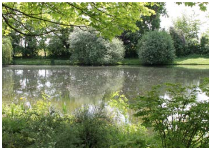
Des espaces naturels préservés

Il est consultable en ligne sur www.sage-cevm.fr .